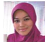
ILI ZAWANI B MAIL BENDAHARI KEHORMAT